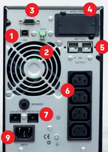
UPS 1 KVA