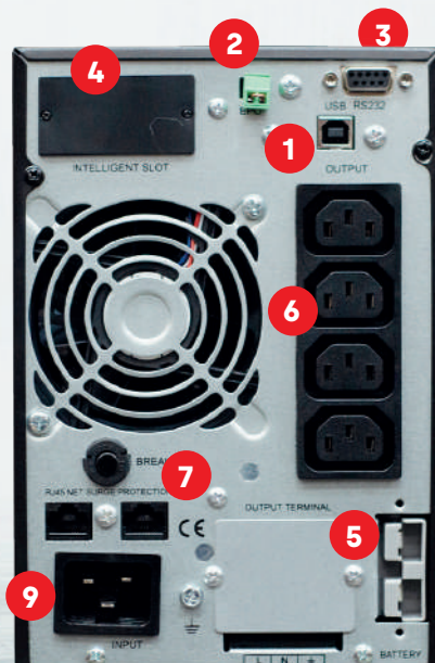
UPS 2 KVA